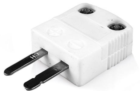
Miniature Hi-Temp Ceramic in-line Plug - HTC (dimensions in mm)

Labfacility are the UK's leading manufacturer of Temperature Sensors, Thermocouple Connectors and associated Temperature Instrumentation and stockings of Thermocouple Cables. The Company has been trading since 1971 and is ISO9001 accredited.