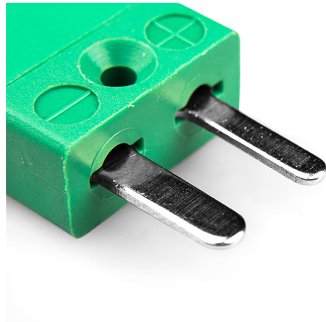
Miniature in-line Plug (dimensions in mm)

Labfacility are the UK's leading manufacturer of Temperature Sensors, Thermocouple Connectors and associated Temperature Instrumentation and stockings of Thermocouple Cables. The Company has been trading since 1971 and is ISO9001 accredited.